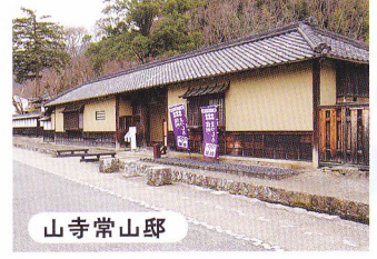
山寺常山邸 松代城下に残る最大(22m)の長屋門。