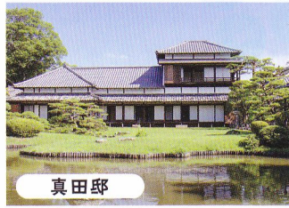
真田邸 奥に見える山も借景として取り入れられた座親式の庭園は、ぜひ座って眺めて。