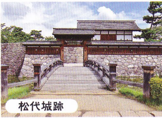
松代城跡 復元された石垣や太鼓門が見事。