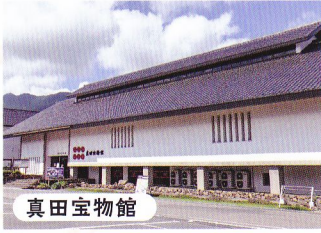
真田宝物館 真田家に伝わる武具、調度品、文書などの大名道具を収蔵・展示する博物館。