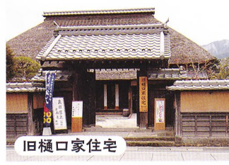
旧樋口家住宅 建造物、庭、泉水路など、松代藩の高級武士の屋敷の姿をよく伝えている。