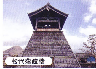
松代藩鐘楼 江戸時代の「時の鐘」。出火の際には警鐘としても使われました。