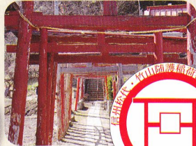
竹山随護稲荷神社