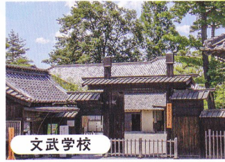
文武学校 創建時の敷地や建物が現存する、全国的にも貴重な藩校。