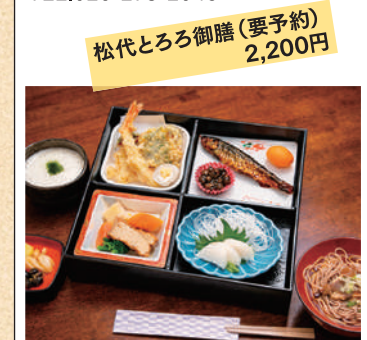
松代とろろ御膳(要予約) 2,200円

営業時間/11:30~15:00 定休日/不定休 TEL.026-278-2045