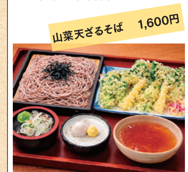
山菜天ざるそば 1,600円

営業時間/11:00~14:00 定休日/火曜日 TEL.026-278-8595