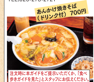
あんかけ焼きそば (ドリンク付) 700円

営業時間/11:00~14:00 17:00~20:00 定休日/日曜日・祝日 TEL.026-278-2721