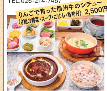
りんごで育った信州牛のシチュー (9種の前菜・スープ・ごはん・香物付) 2,500円

営業時間/11:00~17:00 Dinner 18:00~22:00 (予約のみ) 休業日/不定休 TEL.026-214-7467