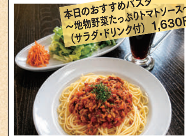
本日のおすすめパスタ 〜地物野菜たっぷりトマトソース〜 (サラダ・ドリンク付) 1,630円

営業時間/ Lunch 11:30~14:00 (LO.13:30) Dinner 17:30~20:00 (LO.19:20) ※Dinnerは土曜日のみ営業(予約制) 定休日/月曜日・日曜日 TEL.026-278-7411