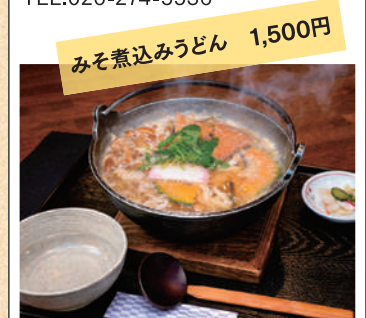
みそ煮込みうどん 1,500円

営業時間/11:30~15:00 (LO.14:30) 17:00~21:00 (LO.20:30) 定休日/水曜日 TEL.026-274-5536