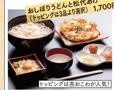
おしぼりうどんと松代あげ (トッピングは3品より選択) 1,700円

営業時間/11:30~14:00 (火曜~日曜) 麵が終わり次第終了 定休日/月曜日 TEL.026-278-0141