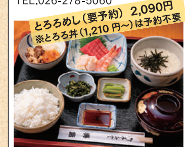
とろろめし(要予約) 2,090円 ※とろろ丼(1,210円)は予約不要

営業時間/11:30~14:00 17:00~22:00 定休日/月曜日 (祝日の場合は不定休) TEL.026-278-5060