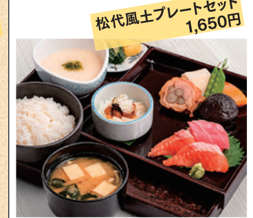
松代風土プレートセット 1,650円

営業時間/11:30~14:00 17:30~21:30 定休日/不定休(週半ばが多い) TEL.026-278-2174