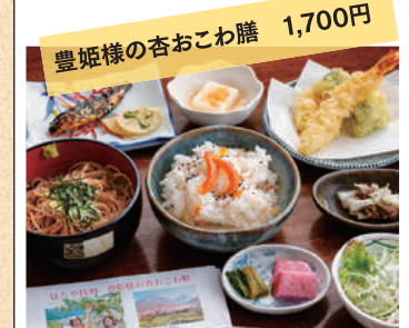
豊姫様の杏おこわ膳 1,700円

営業時間/11:00~16:00 お食事提供 11:30~(LO.13:50) 定休日/月曜日・火曜日 TEL.026-278-8743