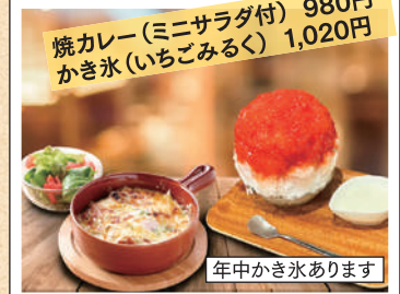
焼カレー(ミニサラダ付) 980円 かき氷(いちごみるく) 1,020円

営業時間/5月~9月 11:00~19:00 (LO.18:30) 10月~4月 11:00~18:00 (LO.17:30) 定休日/火曜日 TEL.026-214-3674